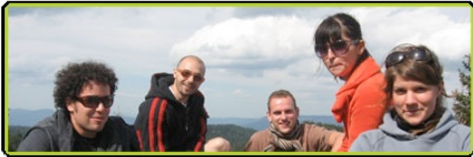
Afb.2 : Kriterion Amsterdam bezoekt Kriterion Sarajevo augustus 2007

De activiteiten van YUA in 2007 richtten zich op :