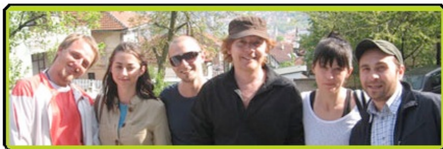
Afb.1 : Filmregisseur Eddy Terstall op bezoek bij Kriterion Sarajevo

Jongeren in kansarme regio's verdienen hun eigen inkomsten en doen werkervaring op. Hun kansen op de arbeidsmarkt worden vergroot. Jongeren krijgen zo de kans om substantieel bij te dragen aan hun eigen toekomst en leefomgeving.